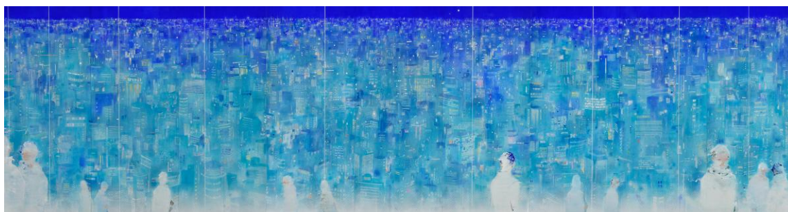
能登 真理亜 「Sleepless Night, Sleepless City」2026年