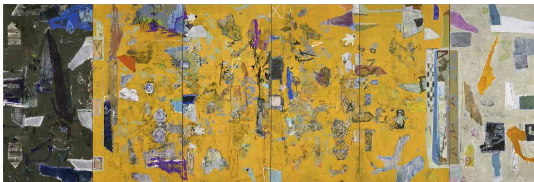
石原 孟 「Land」2026年