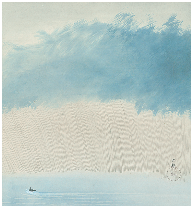
横山 大観「秋」明治32年頃(c.1899) *