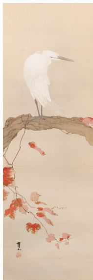
木村 武山「鷺図」大正3-4年(1914-15) 個人蔵