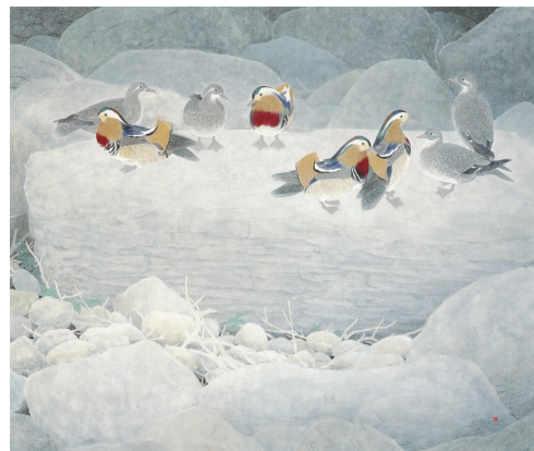
那波多目 功一「憩う」平成5年(1993) 個人蔵