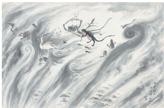
小川 芋銭「水魅戯」大正12年(1923) *