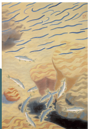
小林 巢居人「鮫」昭和24年(1949) *