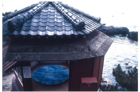
《Kinesis No.215》2004年 茨城県近代美術館寄託 (五浦・六角堂 インスタレーション)