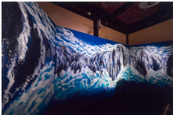
《Kinesis No.705 (jackknife)》2017年(ホテル雅叙園東京 インスタレーション)*