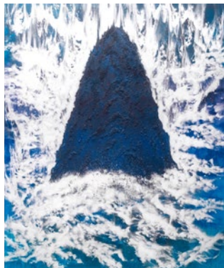
《Kinesis No.749 (sansui)》2021年*