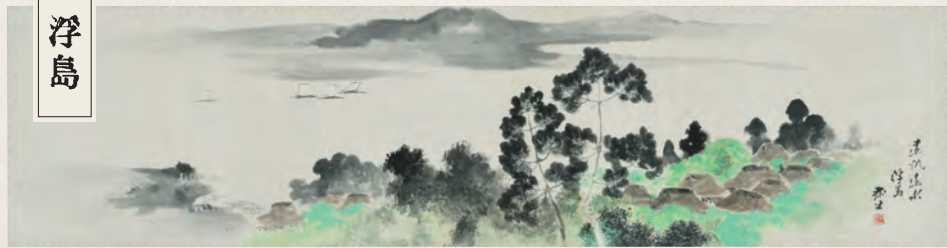
水上泰生《遠帆遠水 浮島》大正6年(1917) 個人蔵