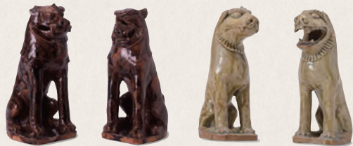
「陶製狛犬」鹿島神宮蔵

鹿島神宮・香取神宮が所在する利根川下流域は、中世以前は香取海が広がっており、その周縁で一つの文化圏を形成しました。本展覧会では、考古、民俗、歴史、美術の複数の分野、そして古代から現代までの長期的時間軸の視点から、その文化的様相をみていきます。