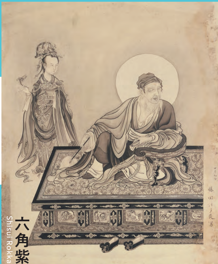
六角紫水 Shisui Rokkaku