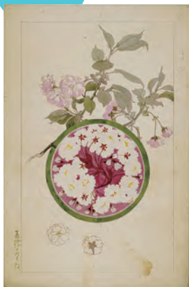
高橋昇太郎(五山)《図案》 明治39年頃(c.1906) 当館蔵