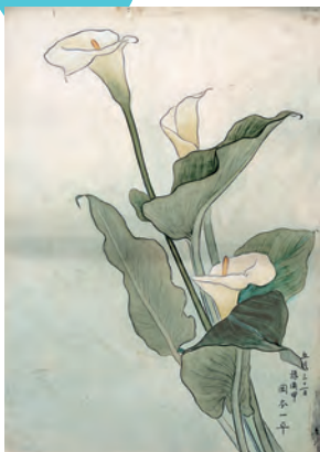
岡本一平《写生(海芋)》 明治38年頃(c.1905) 当館蔵