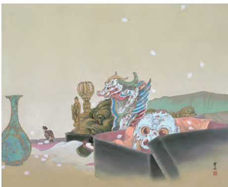
木村武山《春暖 古面蘭陵王》 昭和7~10年頃(c.1932-35) 個人蔵