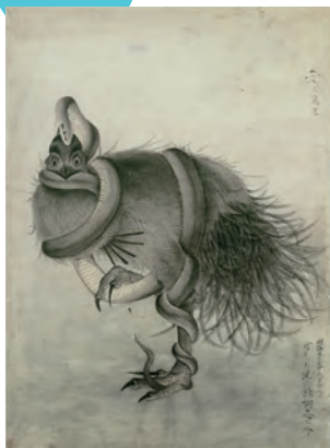
新納忠之介《新案》 明治23年(1890) 当館蔵