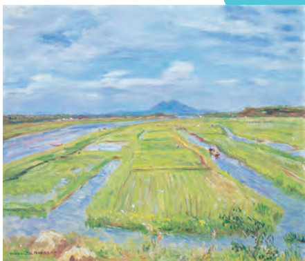
中澤弘光《水郷より筑波遠望》 昭和30年代(c.1955-64) 茨城県近代美術館蔵