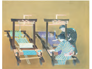
5 “清新端正、厳肅な至上美”

【作品名】 1.「十六羅漢像(第七尊者)」鎌倉時代 金龍寺 重要文化財 2.富田溪仙「淀城」昭和5年(1930)個人蔵 3.横山大観「鶉」大正14年(1925)水野美術館蔵 4.川端龍子「胎蔵」大正12年(1923)個人蔵 5.小林古径「機織」大正15年(1926)東京国立近代美術館蔵