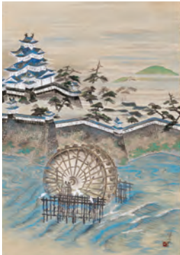
2 海外で紹介された溪仙の逸品