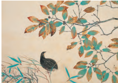
3 大観“代表作ならぬ代表作”