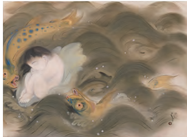
4 龍子、幻の院展出品公開