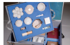
[トランクのイメージ]