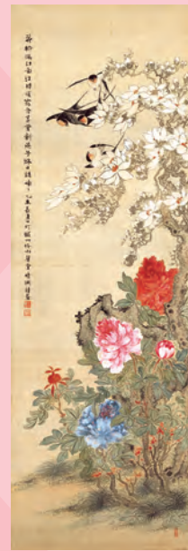
奥原晴湖「富貴飛燕 芙蓉翡翠」明治28(1895)年 茨城県近代美術館蔵