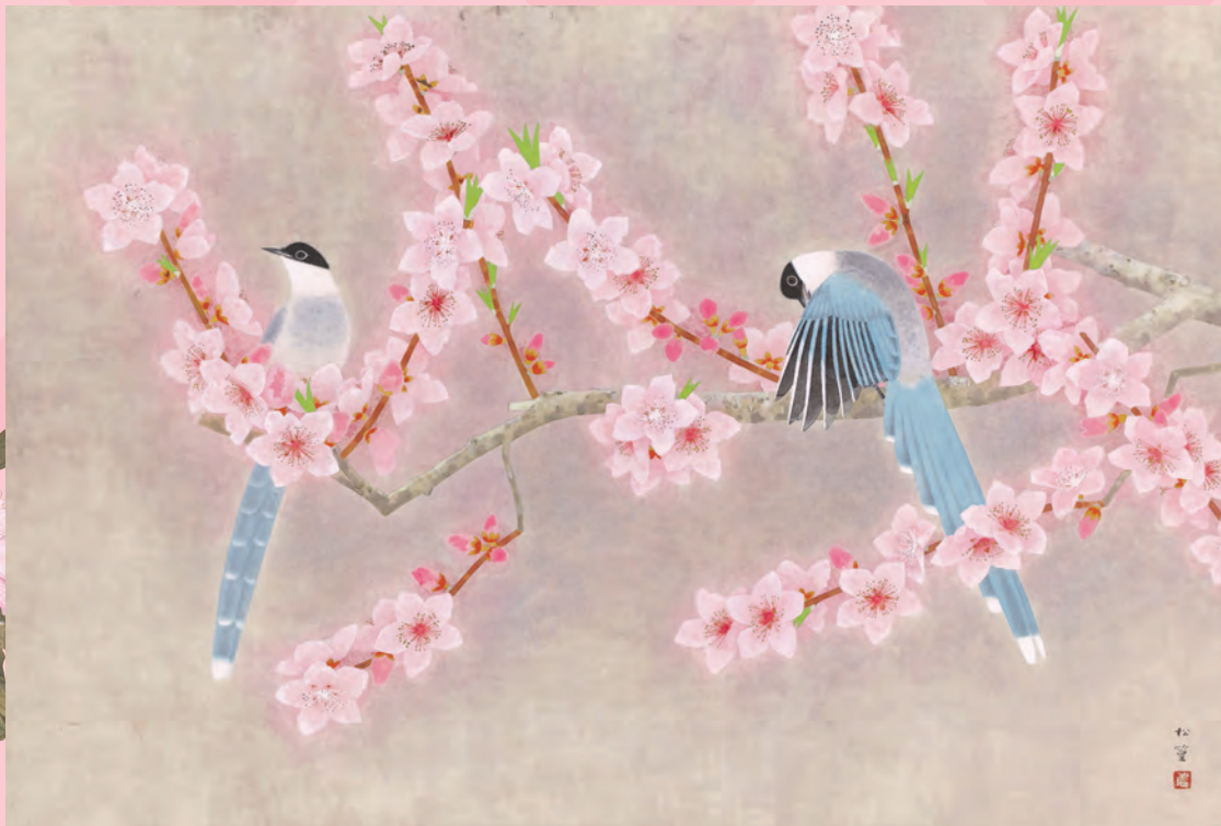
上村松堂「桃花」昭和56(1981)年 国際交流基金蔵 ©Atsushi Uemura 2021 / JAA2100325