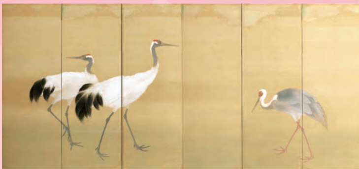
木村武山「群鶴(其一)」大正13(1924)年 個人蔵