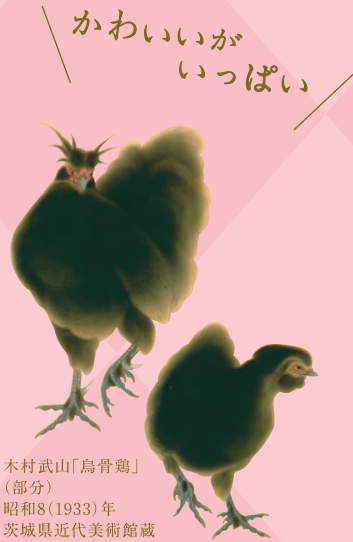
木村武山「鳥骨鶏」(部分) 昭和8(1933)年 茨城県近代美術館蔵