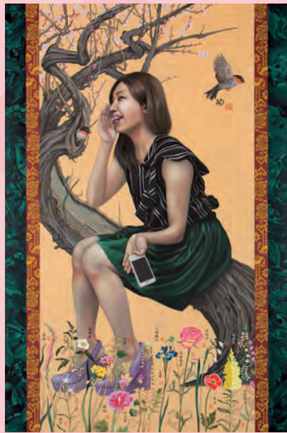
田中武「曙〜十六恥漢図シリーズ〜」平成27(2015)年 茨城県近代美術館蔵