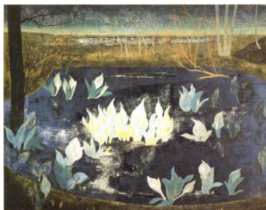
松本祐子「春の始まる時」平成 12 年（2000）個人蔵