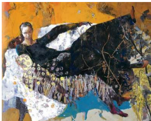
宮いつき「ふたり」平成 12 年（2000）個人蔵