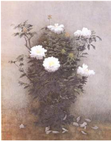
那波多目功一「惜春」 平成 19 年（2007）個人蔵