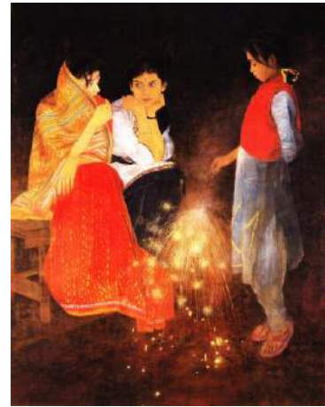
梅原幸雄「線香花火」 平成 5 年（1993）個人蔵