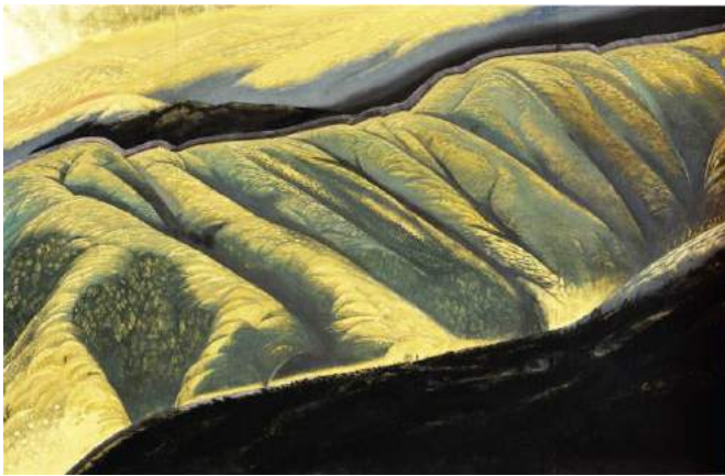
浅野均「高原風光」平成 11 年（1999）個人蔵