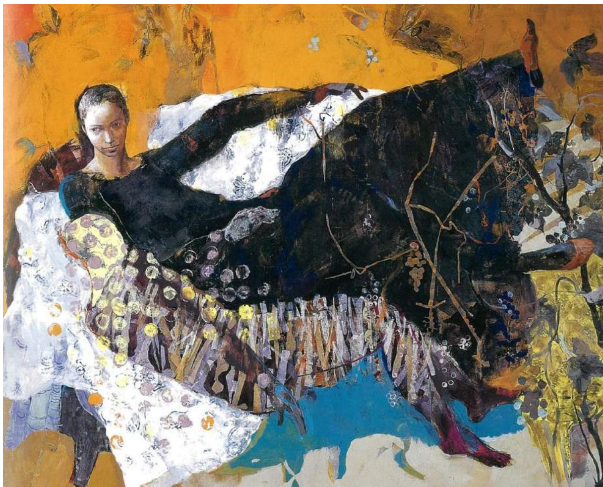
宮いつき「ふたり」平成12年(2000)個人蔵