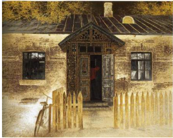
小田野尚之「来客」平成 13 年（2001）個人蔵