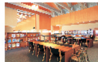
美術情報ライブラリー

岡倉天心関係資料や、美術関連図書の閲覧、DVDなどが視聴できます。キッズ向けの絵本やDVDなども用意しています。