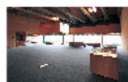
展望ギャラリー2 展望ギャラリー1