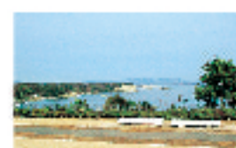
津海広場より小名浜を望む