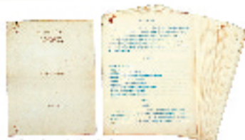
岡倉天心のオベラ本 『The White Fox』(白狐)草稿 大正2年(1913)