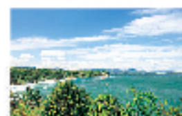
展望台より長浜海岸を望む