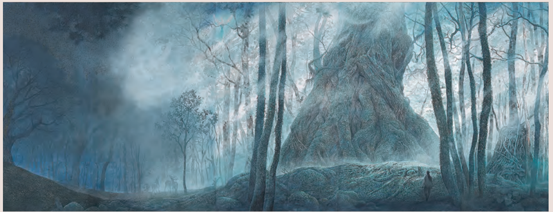
「不死鳥」(部分) 2022年～ 個人蔵