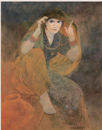
「水汲みのマヤ」1999年 郷さくら美術館蔵