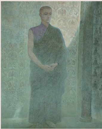
「寂光」1996年 茨城県近代美術館蔵